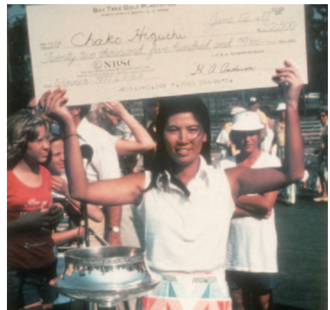
1977年 全米女子プロ選手権