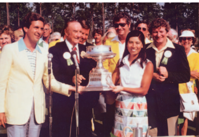
1977年 全米女子プロ選手権