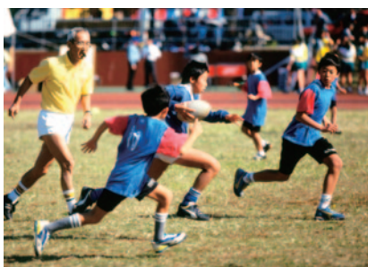
子供たちがスポーツを楽しむ