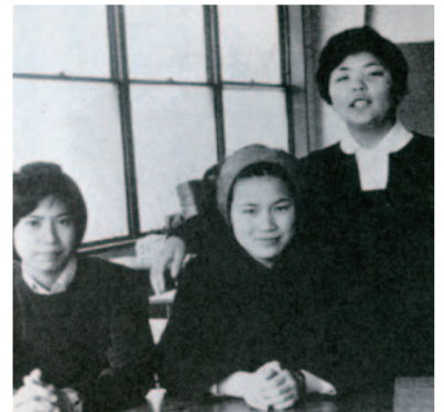
高校生時代(左)クラスメイトと共に

中学校では陸上競技部に入り80mハードルをやっていました。その陸上競技を伸ばそうとして二階堂高校に進学するのですが、川越から通うのが遠くて、世田谷に住んでいた姉のもとから通学することになりました。それで単身、川越から東京の世田谷に引っ越したわけですけど、近所に友だちがいなくて土曜、日曜日になるとゴルフ場に勤めていた姉にくっついてゴルフ場に行っていました。