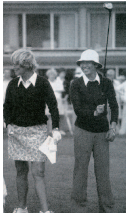
海外ツアーで活躍