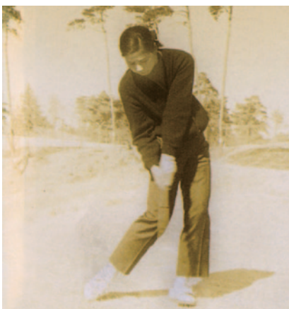
1968年 川越カントリークラブで練習に励む