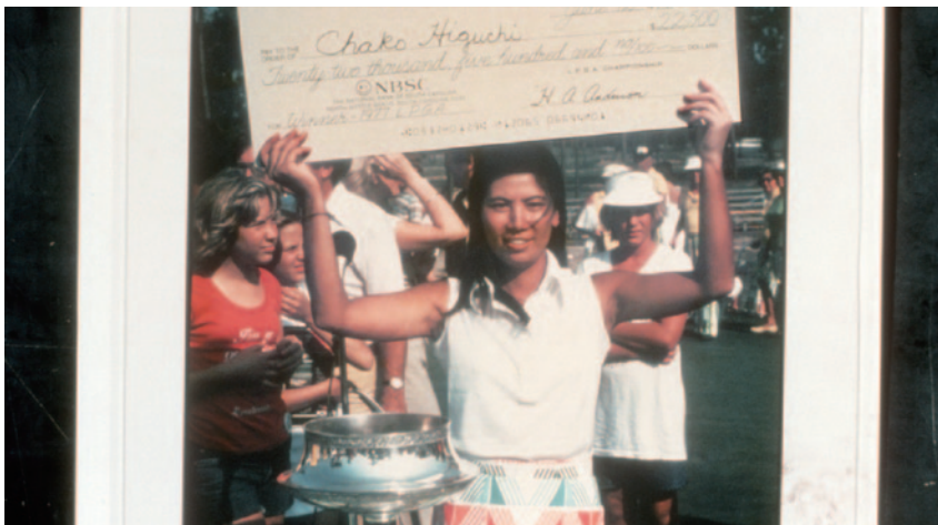
1977年 全米女子プロ選手権