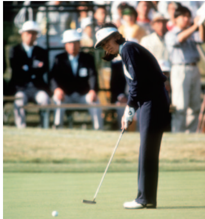
グリーン上でのパッティング