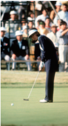
グリーン上でのパッティング

ワンストロークの差で賞金が倍くらい変わるので。そこでワンストロークの重みというモノを覚えめました。私たちはミズノというスポンサーがついていましたから移動なんかも飛行機が使えるし、車の移動もレンタカーで1時間も走ればよかったです。アメリカの選手は自分の車で全行程移動するわけです。それも6時間、7時間も車で移動してくるのでからタフですよ。