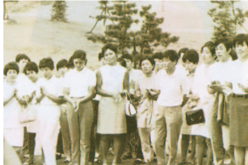
日本女子オープンを連覇(TBS越谷GC) 表彰式

日本にアメリカのプロ選手が来てエキシビジョンをする予定が、風邪ひいてキャンセルになってしまったのです。それで、所属先のミズノに「日本でアメリカ人選手と試合できないならアメリカに行かせてください」とお願いしました。アメリカ選手は、どれくらい飛ばすのか、どんなゴルフをするのか、ということに興味がありました。それでアメリカのツアーはどんなものか、何人くらいで試合をしているのか、というような情報を収集しました。私は、10試合に出場することを目標として4月から6月まで3カ月間アメリカに行っていたのですが、それはなぜかという毎年7月に日本女子プロ選手権の