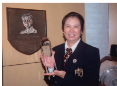
殿堂入りを果たす