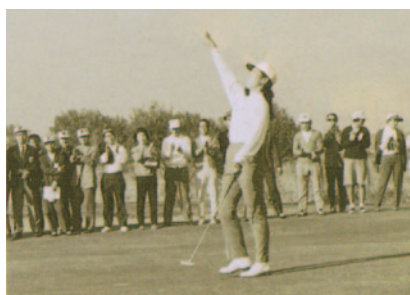
日本女子オープンを連覇(TBS越谷GC)