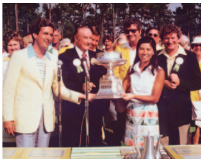
1977年 全米女子プロ選手権