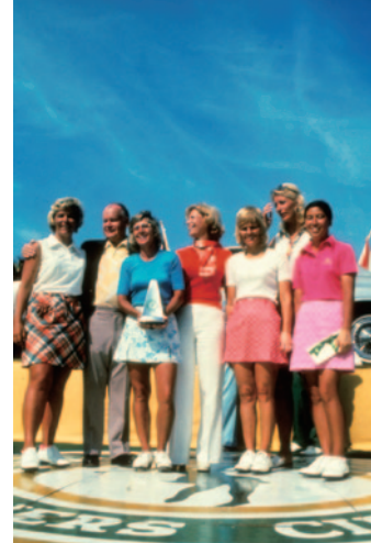
1976年 コルゲート・ヨーロップ・オープン