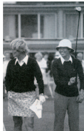
海外ツアーで活躍