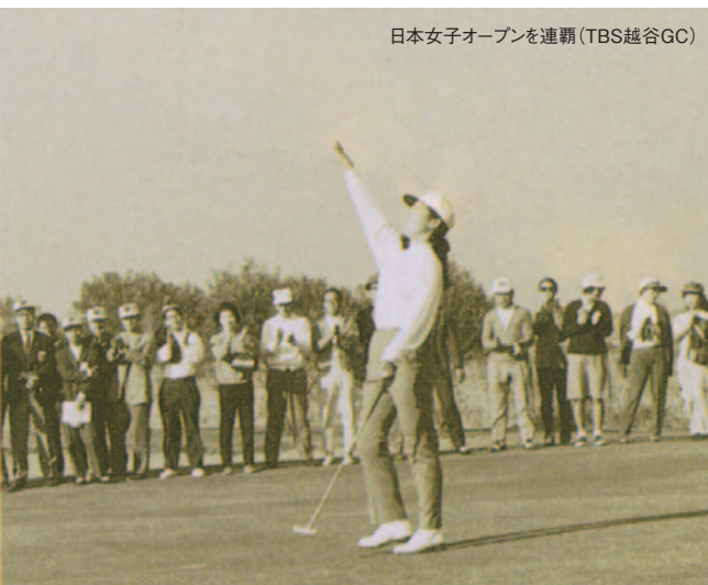
日本女子オープンを連覇(TBS越谷GC)

すぐには軌道には乗いませんでした。やっとな産声をあげたばかりでしたから、世間の人たちに認知されないうちに早く身につけなければならぬと思い、たくさんボールを打ちました。あまり考えずに普通にスイングしていたのですが、中村先生は、身体が小さいので自分で常にボールを遠くに飛ばすのは、どうしたらいいのか、いつも考えていました。だから、こうやってみる、ああやってみる、ということ