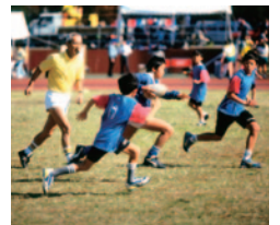
子供たちがスポーツを楽しむ