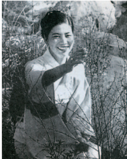
成人式(川越カントリークラブで)