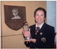
殿堂入りを果たす

スポンサーが見つからない。帰って来ると試合がポチポチ出てくる。それで、翌年から日本に残ることにしたら、春先から夏にかけてもスポンサーがつき、試合が増えました。