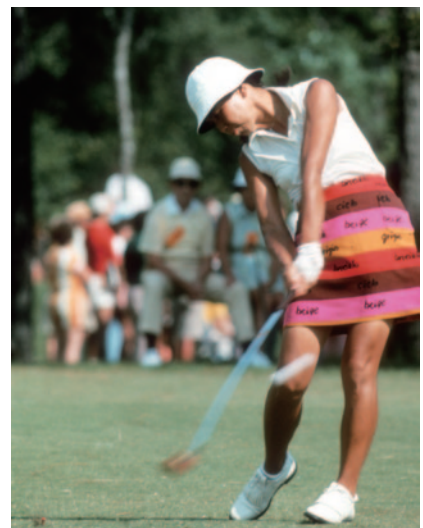
1977年 日本女子オープン