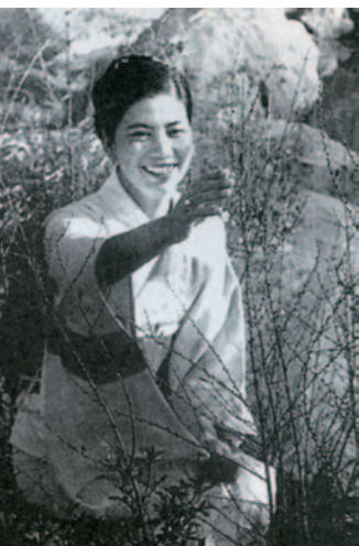
成人式(川越カントリークラブで)