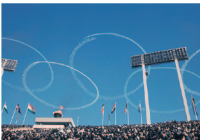
1964年 東京オリンピック開会式