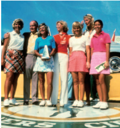
1976年 コルゲート・ヨーロッパ・オープン