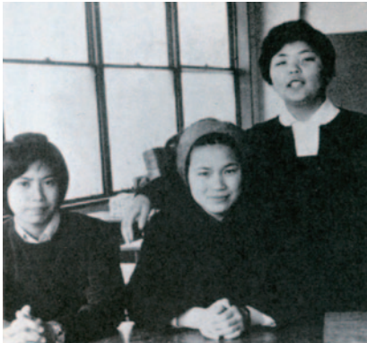
高校生時代(左) クラスメイトと共に