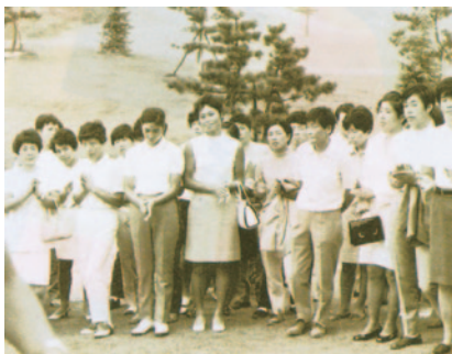
日本女子オープンを連覇(TBS越谷GC) 表彰式